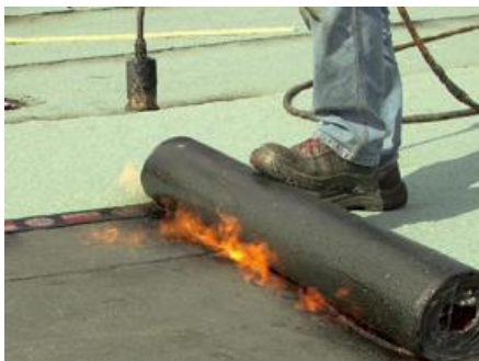
FIGURE 2 Soudage d'une membrane bitumineuse au chalumeau

Les membranes bitumineuses arrivent sur le chantier sous forme de rouleaux souvent de 1 m de large et de 5 à 10 m de long. Lors de la mise en œuvre, le rouleau est continuellement chauffé avec un chalumeau et déroulé sur le bitume fondu (cf. Figure 2). En plus de ces travaux effectués sur de grandes surfaces, des travaux de détails sont nécessaires dans les angles et les bords, au niveau des gaines de ventilation, des lanternaux, etc. Lors de ces travaux de finitions, les membranes bitumineuses sont découpées à la bonne taille, chauffées, puis collées.